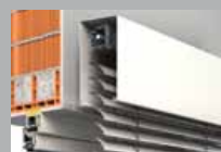
Aluminium-Raffstore Freitragendes Fassadensystem