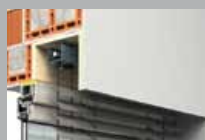
Aluminium-Raffstore Seilgeführtes Fassadensystem