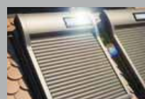
Dachfensterrollladen WERSO mit Solarantrieb

ROMA bietet die ideale Beschattung für Privat- und Gewerbegebäude. Stets maßgefertigt aus hochwertigem Aluminium und mit serienmäßiger Motorbedienung.