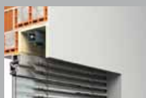
Aluminium-Raffstore Schienengeführtes Fassadensystem

ROMA bietet die ideale Beschattung für Privat- und Gewerbegebäude. Stets maßgefertigt aus hochwertigem Aluminium und mit serienmäßiger Motorbedienung.