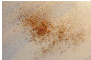
Mit Paprikapulver verschmutztes Tuchgewebe