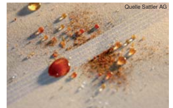
Paprikapulver wird mit der Flüssigkeit abtransportiert und das Tuch erstrahlt in neuem Glanz